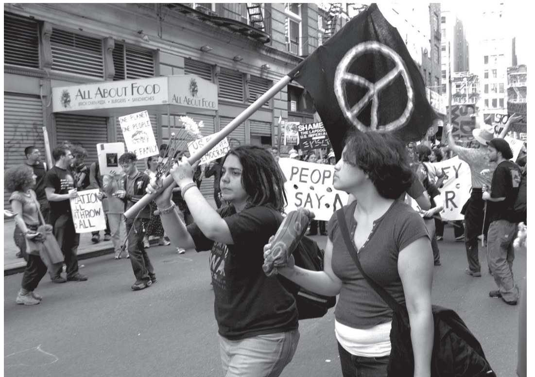
Vorbereitungstreffen in Straßburg

Wir wollen aber auch in Straßburg gegen die Übermacht der Polizei und der Sicherheitstruppen – diese neue Welt vorleben und diese der Weltöffentlichkeit zeigen. Mit dem Geld allein dieser Polizeieinsätze könnte die Malaria auf der Erde ausgerottet werden.